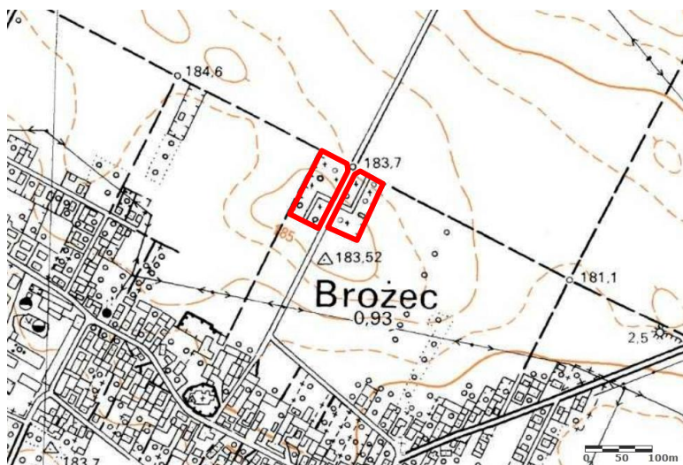
Mapa z lokalizacją obiektu

Ustalenia ochrony w miejscowym planie zagospodarowania przestrzennego (Uchwała nr V/23/03 z dnia 03 lutego 2003 r. Rady Gminy Walce)