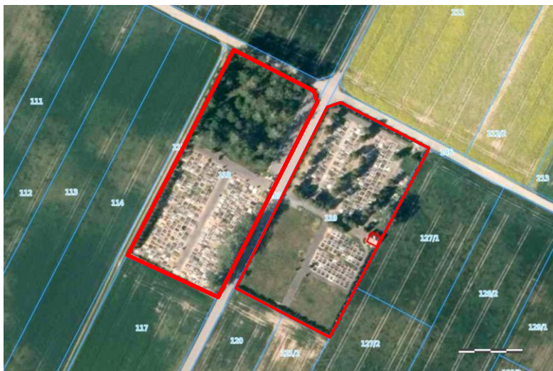
Widok z lotu ptaka

7. Fotografia z opisem wskazującym orientację w stosunku do sąsiednich terenów lub stron świata albo mapa z zaznaczonym stanowiskiem archeologicznym