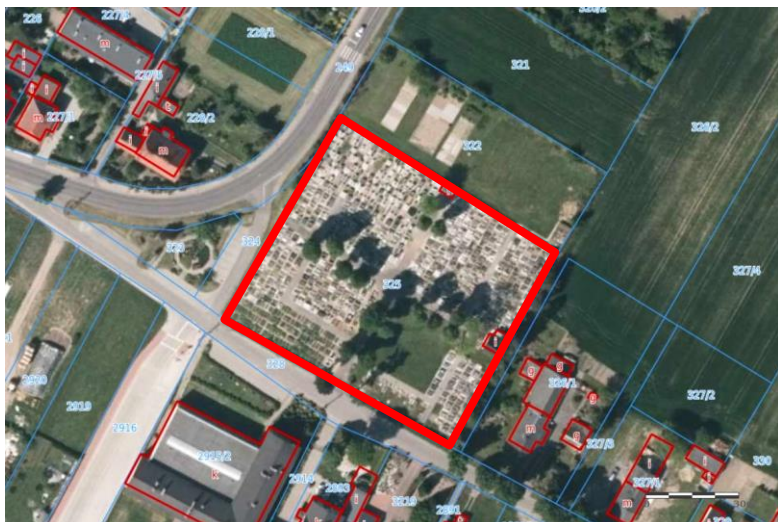
Widok z lotu ptaka

7. Fotografia z opisem wskazującym orientację w stosunku do sąsiednich terenów lub stron świata albo mapa z zaznaczonym stanowiskiem archeologicznym