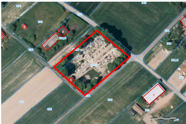
Widok z lotu ptaka

7. Fotografia z opisem wskazującym orientację w stosunku do sąsiednich terenów lub stron świata albo mapa z zaznaczonym stanowiskiem archeologicznym